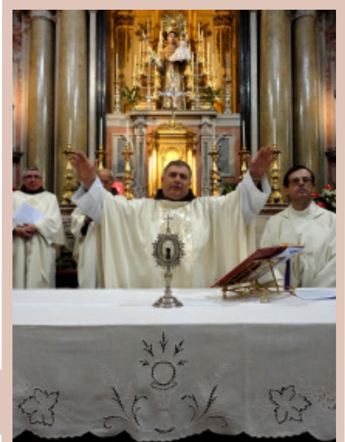
Superior Geral OFM, dá a bênção, no final da Eucaristia, com o Relicário do osso do braço do Santo.

Levantemo-nos. Caminhemos pelas estradas desta amada Europa que necessita de discípulos e de missão. Santo António nos obtenha do Senhor a graça de nos pormos a caminho. Levantai-vos, ide, a Europa vos chama!