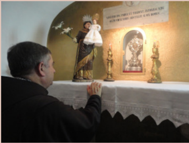
Superior Geral OFM, venerando a Relíquia do Santo, no lugar onde Antrónio nasceu.